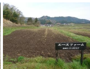
4. 荒起こし後の水田